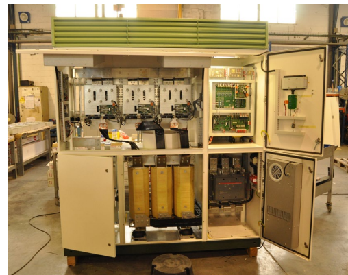
Los inversores PV WD y los sistemas BCPS WD han obtenido la certificación cULus