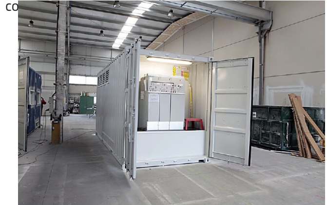
GP Tech's APIS indoor en fase de pruebas para la certificación cULus

Además, los PV500WD y los PV630WD, así como los BCPS500WD y los BCPS630WD, han conseguido la certificación cULus, que indica conformidad con los requerimientos de Canadá y Estados Unidos. Los tests que estos equipos deben cubrir para conseguir la certificación cULus son los mismos que los que se exigen para la UL; aunque incluyen, también, otras pruebas como los tests anti-isla.